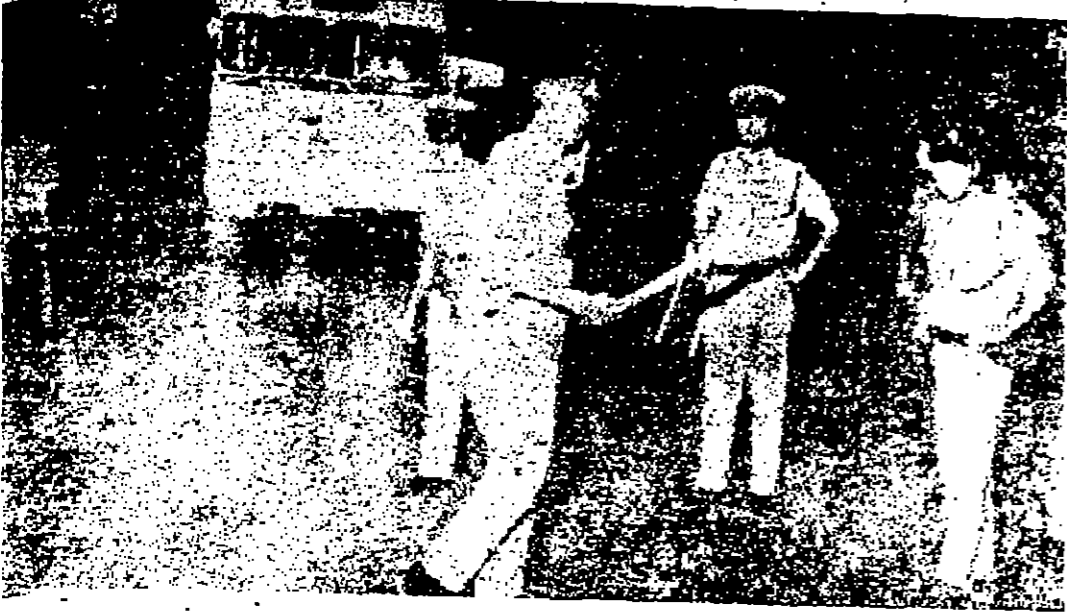
احل جيش الاحتلال الإسرائيلي مدينة الخليل وفرض عليها منع التجول ومراس مختلف اساليب الازعاج في احياء التجار الذي اصاب اكثر من خمسين اسراليا في الحرم الابراهيمي